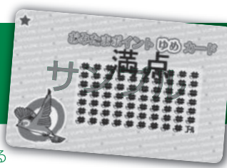
おみたまポイントゆめカード

おみたまポイントゆめカードは、 小美玉市内の加盟店で利用できる お得なポイントカードです。