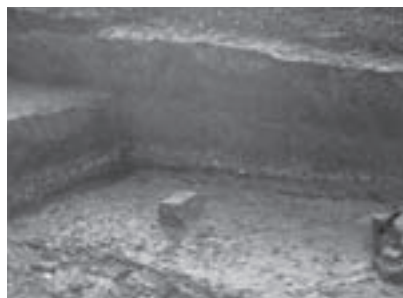
立延低地遺跡の自然貝層