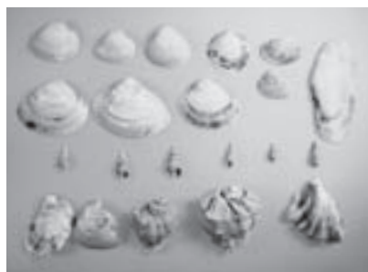
自然貝層から出土した貝

と、ここから比較的大規模な自然貝層が出てきました。これは、自然に死んだ貝があたかも貝塚のように層をなして形成されたものです。これがあるということは、ここがその昔、砂浜のようにひろがる海岸であったという事です。そして、この自然貝層の周辺から、土器を中心とした縄文時代前期の遺物が出土したのです。