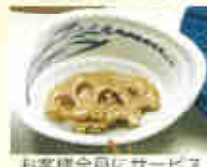
お客様全員にサービス