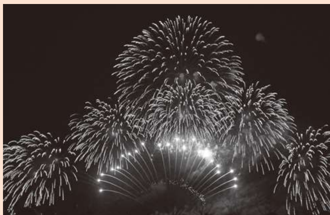
▲昨年開催された第1回おみたま花火大会