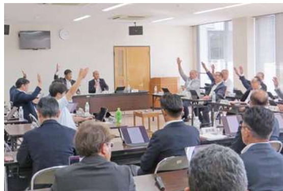
◀9月9日決算特別委員会採決時の様子