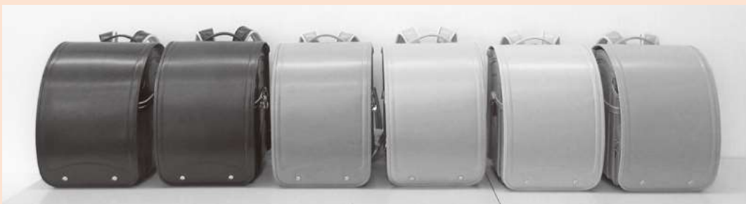
▲左から、黒色(ブラック)紺色(ネイビー)茶色(キャメル)赤色(ビビッドピンク)紫色(スマイル)水色(サックス)