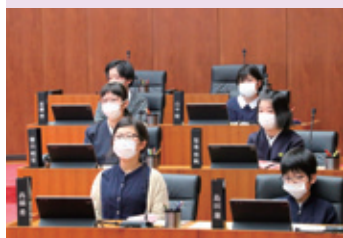
⑦答弁を聞く子ども議員たち