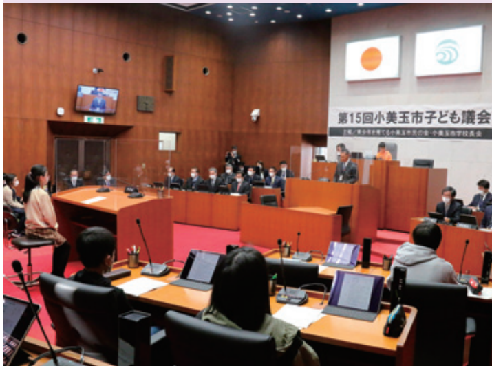
④本物の市議会さながらの雰囲気の中、子ども議会開会！