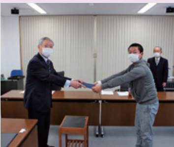
②一日子ども議員！議員証書授与