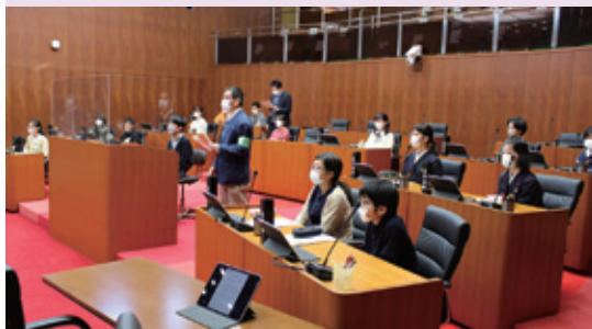
③リハーサルを行います