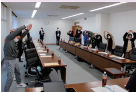
①子ども議員集合！ストレッチで緊張をほぐそう