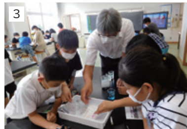
1 グリーンカーテン(SDGs:低学年) 2 縦割り班活動(ロング昼休み) 3 水質調査(SDGs:5年)