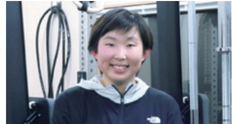
(株)ミサト トレーニングジム モアパワー店長