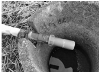
対策で蛇口を取り外した給水管