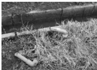
蛇口を盗難された給水管

近年、茨城県内で水田への給水用蛇口の盗難が相次いで発生しています。県央地区では昨年度4件の被害が発生し、被害額は130万円以上となっています。対策例を参考に、盗難被害の防止に努めましょう。