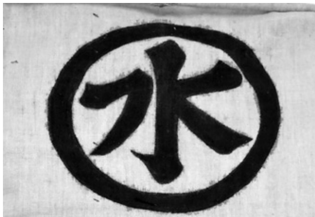
船印（江戸時代）小川資料館蔵

昨年10月から12月にかけて小川資料館で開催した、小川地区の水運と河岸にまつわる展示の巡回展を行います。江戸時代の小川地区・下吉影地区の水運の歴史をはじめ、水運を通じた水戸藩と小川の関わりなどを紹介します。