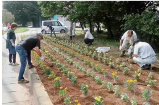
花づくり活動をする花館区の皆さん