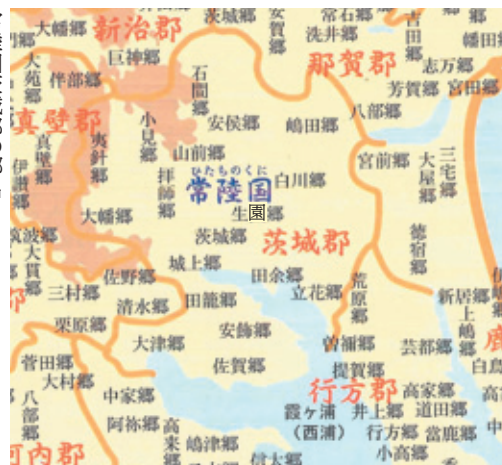
常陸国茨城郡の郷名(茨城県立歴史館よみがえる古代の茨城)図録より

語句解説 律令体制 大化の改新以後、中央集権的国家が制定した公法。地方行政組織として、国評里制がとられた。 藤原京 7世紀末にできた、平城京の前の都。 木簡 墨で文字を書くために使われた細長い木の板。都城などの発掘調査で大量に出土している。 贄 神や朝廷に捧げる土地の物産。 郡衙 律令制下の郡役所。郡家とも表記される。