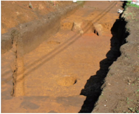
部室平遺跡第1号竪穴建物跡

硯1点、長さ25cmほどの刀子（ナイフ）1点、東海地方産の須恵器などの遺物が出土したことです。