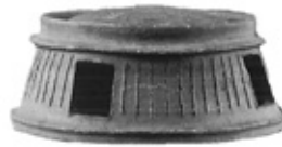
硯面円面(硯面報告書より) 遺跡出土(茨城県教育財団)

部室平遺跡の硯は大型竪穴建物跡で出土していることから、村長クラスが戸籍などの文書作成に関わっていたと推定できま