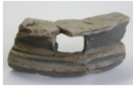
部室平遺跡出土円面硯

令和3年10月、小美玉市部室に所在する部室平遺跡の発掘調査が行われ、8世紀初頭頃の竪穴建物跡が発見されました。この建物跡は一边が7m以上ある大型のものでした。注目されるのは、硯2点、転用