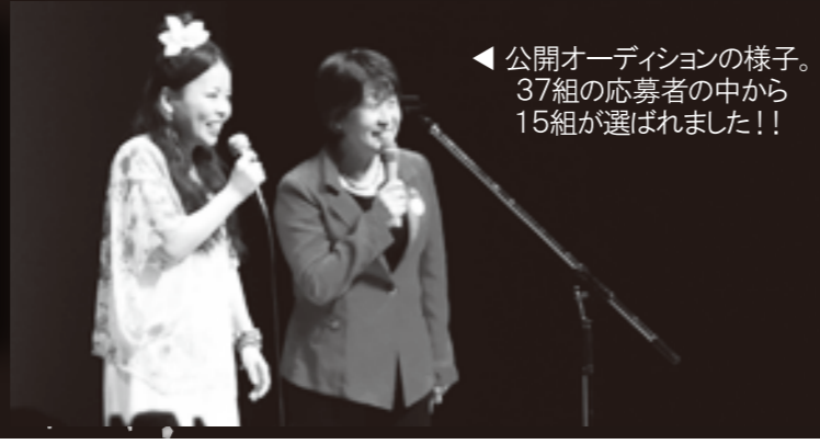
◀ 公開オーディションの様子。37組の応募者の中から15組が選ばれました!!

チケット発売:2月2日(土)10:00~ / 本公演:3月23日(日)15:00開演 ◆入場料:大人1,000円/高校生以下500円 ※全席指定 ※2歳以下入場不可