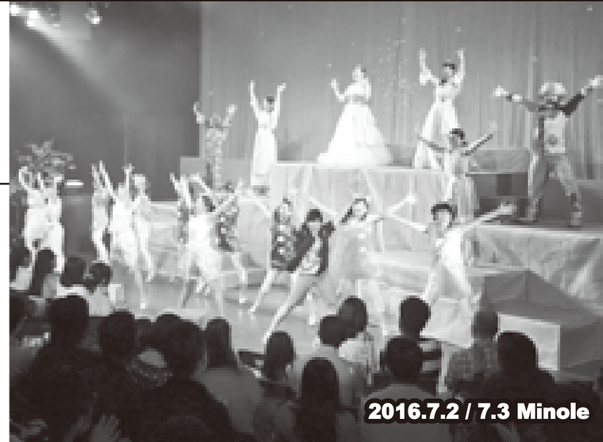
2016.7.2 / 7.3 Minole

小学生だったメンバーがキラキラ輝くレディになって活動をしているMyuユースプロジェクト。今回のミュージカル「Twinkle☆Twinkle」は、キャスト・スタッフの熱い思いが満員の客席にも伝わり、子どもから大人までレベルの高いお芝居やダンスに魅了されていました。星の妖精たちのお話は、子ども達の心の中にいつまでも輝き・・・大人は忘れかけていた大切なことに気付いた事でしょう。<みのんぱ編集部 藤田 佐知子>