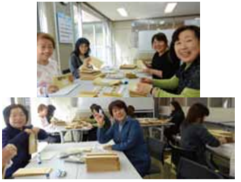
4/18 ラインナップ詰め作業