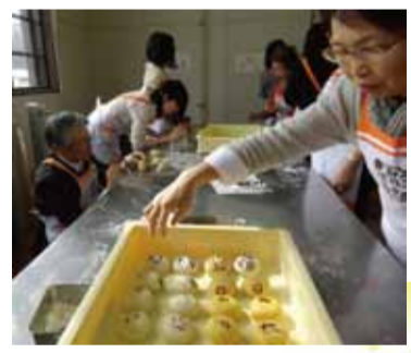
おやしき学校 みんな上手にできましたヨ！