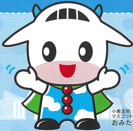
小美玉市 マスコットキャラクター おみたん