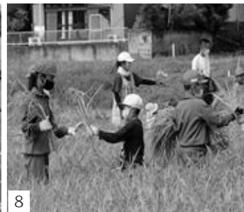
1__入学式 2__あいさつ運動 3__遠足(アクアワールド大洗水族館) 4__ミュージカル 5__ミュージカル 6__運動会 7__持久走記録会 8__稲刈り

下吉影小学校は、明治10年に創立した144年目の学校です。全校児童は52名です。子どもたちは、のびのびと、お互いに助け合って仲良く生活しています。学校は、豊かな自然に囲まれ、木の温もりのある校舎、広い運動場や冷暖房完備の体育館等、施設・設備も整っています。恵まれた環境の中、保護者の皆さまや地域の方々のご支援・ご協力を得て、小規模校のよさを生かした学習や学校行事に楽しく意欲的に取り組んでいます。