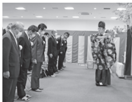
関係者が安全祈願を行いました