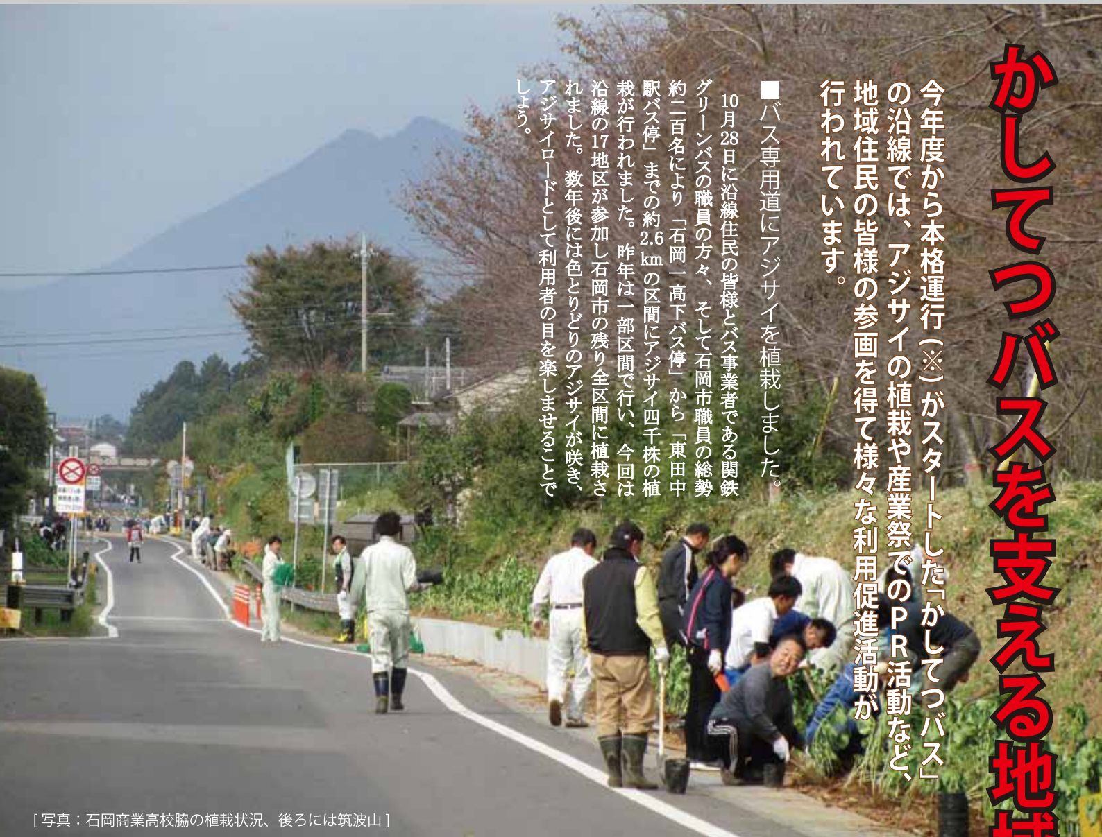
[写真：石岡商業高校脇の植栽状況、後ろには筑波山]

10月28日に沿線住民の皆様とバス事業者である関鉄グリーンバスの職員の方々、そして石岡市職員の総勢約二百名により、「石岡一高下バス停」から「東田中駅バス停」までの約2.6kmの区間にアジサイ四千株の植栽が行われました。昨年は一部区間で行い、今回は沿線の17地区が参加し石岡市の残り全区間に植栽されました。数年後には色とりどりのアジサイが咲き、アジサイロードとして利用者の目を楽ませることでしよう。