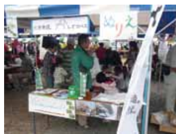
おみたま産業まつり「ぬりえ」の風景