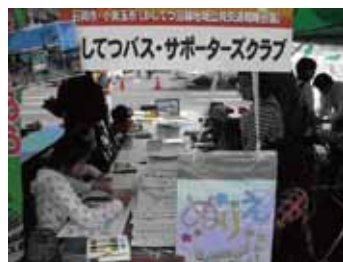
石岡市産業祭「ぬりえ」の風景

石岡市産業祭(10月13・14日)及び、おみたま産業まつり(10月28日)において、かしてつバスのPRブースを設置し、かしてつバスを利用して来場した方へのプレゼントや子ども達による「ぬりえ」などを行いました。たくさんのお子様も描いていただいた「ぬりえ」は、これからかしてつバス車内のかしてつギャラリーに展示されますので、ご乗車の際は是非ご覧ください。