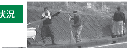
4回ふれあいと交流のセンターま