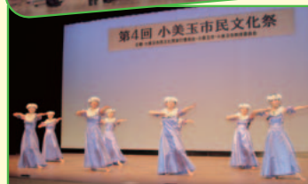
第4回 小美玉市民文化祭