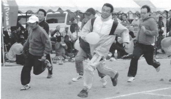
▲さわやかな野田をつくる会 (第1回ふれあい運動会) H21.10.25

まちづくり組織の活動 各地でさまざまなイベントを開催し、学区まちづくり組織が活動しています。