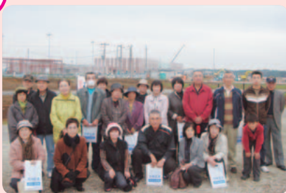
茨城空港ターミナル地区周辺にて

見学を終えて、参加者からは、就航を表明しているアジアナ航空の運賃のことやパスポート取得にかかる日数などについて等、茨城空港を利用するにあたっての具体的な質問がありました。