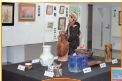
手芸作品・生け花