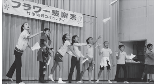
▲竹原地区コミュニティ (フラワー感謝祭) H21.11.1