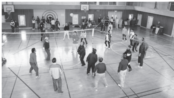
◀玉里小学校区コミュニティ (第1回世代間交流球技大会) H21.11.14