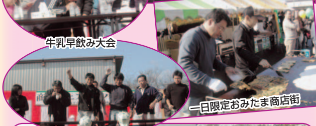
一日限定おみたま商店街