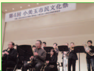
第4回 小美玉市民文化祭