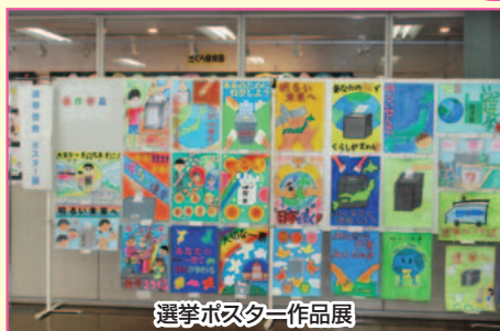
選挙ポスター作品展