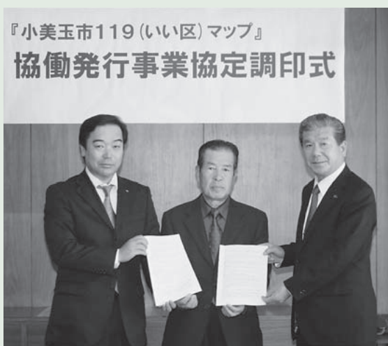
(写真左から、ゼンリンの吉川首都圏支社長、緑川実行委員長、島田市長)

小美玉市のことをよく知らない、わからないといった市民が多いなか、市内にある119行政区を1つ1つ丁寧に紹介することで、そうした状況を少しでも改善し、市民相互の一体感の醸成と地域経済の活性化を図ることを目的としています。