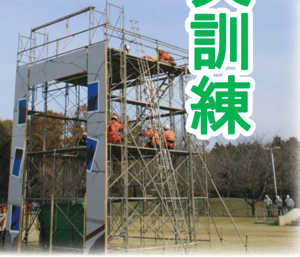
県と市消防の共同で行われた捜索・救助訓練 実際の現場を意識した緊張感ある訓練でした

3月11日に東日本大震災が発生し、小美玉市においても大きな被害がありました。今、市民の皆さんの防災に対する意識は高まっていることから、訓練には概ね1,000人が参加。個人あるいは地域で参加する方、消防や自衛隊など組織で参加する方がそれぞれの役割を確認し、訓練に励みました。