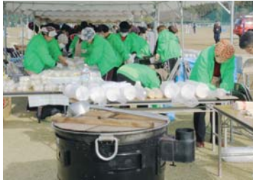
給食支援活動 炊きたてのおにぎりで心も暖かく