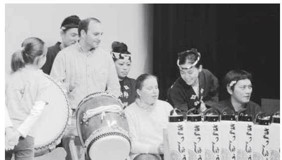
お囃子の体験 和太鼓に興味津々です