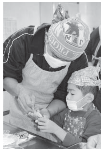
親子共同作業で餃子の「ひだ」を作っています 大切なのは協力すること！

参加した男性保護者と子どもたちからは「協力しながら作ることができて、とても楽しかった！」「親として子どもに経験をさせることの大切さを知りました」などの感想が寄せられました。餃子はジューシーに、中華風スープは塩分を控えめにしたことにより、玉ねぎの甘さが引き立ちました。ヨーグルトチーズケーキは簡単に美味しくできて「家に帰ってから、また作る！」という声が会場からあがりました。普段、お父さんやおじいちゃんと料理をする機会が少ない子どもたちは、笑顔でうれしそうに料理づくりを楽しみ、絆を深めました。