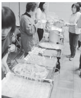
個性豊かなお国の料理