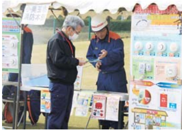
家庭での火災にも注意！ 住宅用火災警報器を設置しましょう