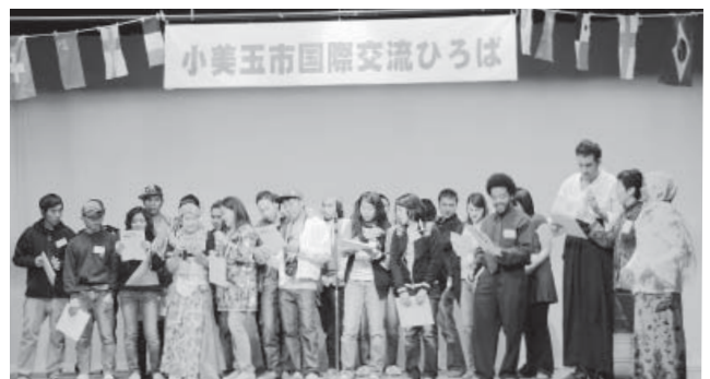
イツ・ア・スモールワールドをみんなで合唱 世界はひとつ!

会に参加していた外国人の方は「今日のように日本人と交流を深められる機会があると非常にうれしい。いろんな国の料理を味わうことができたし、文化についても様々でとても新鮮だった。友達もたくさん作れました」と、新しくできた友達と一緒に話していました。