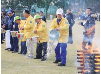
バケツリレーで初期消火 地域で協力して被害を最小限に！