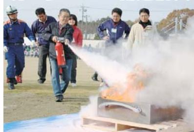
消火器を使った消火訓練 使用経験があることで安心です