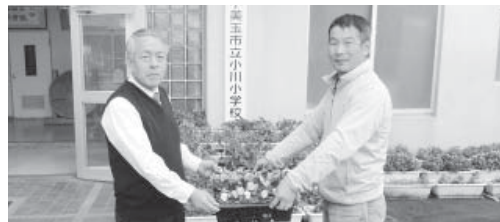
協議会より各小学校へ花の苗を配りました

12月7日、小美玉市認定農業者協議会が「植物の育成を通じて自然に親しみ、また花の成長していく様子を見て育てる喜びを感じてもらいたい」と、花の苗1,100株を市内の各小学校へ寄贈されました。