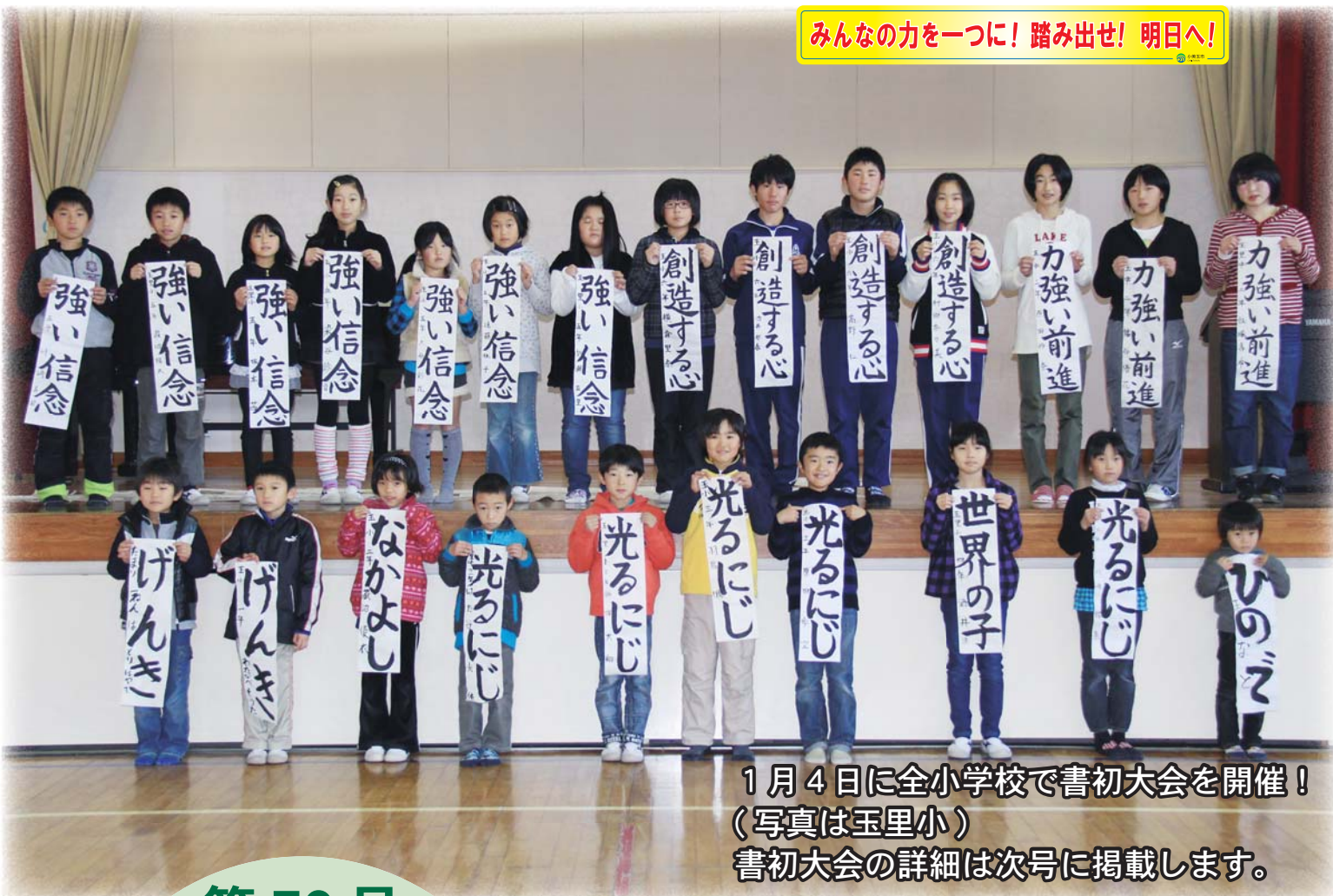
1月4日に全小学校で書初大会を開催！ (写真は玉里小) 書初大会の詳細は次号に掲載します。