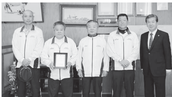
市役所に報告に訪れた委員の皆さん（左から4名）

11月10日から11日にかけて東京体育館で行われた、全国スポーツ推進委員研究協議会において、これまでの功績がたたえられ小美玉市スポーツ推進委員会が団体表彰を受賞しました。委員の皆さんは「体育指導委員からスポーツ推進委員と名称の変更があり、心機一転さらに活躍の場が広がるよう頑張っていきたい」と意気込んでいました。