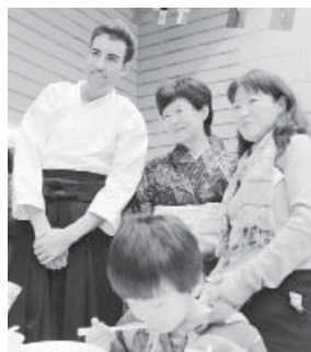
お友達になりました