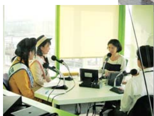
▲ ラジオで茨城の魅力を PR