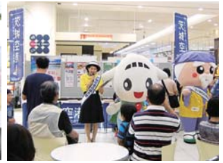
▲ イオンモール店内にて