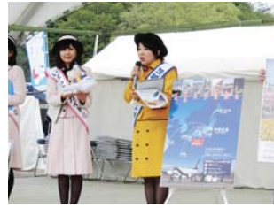
▲ 陶炎祭のステージにて

GWに開催された陶炎祭(ひまつり)や、イオンモール土浦にて、茨城空港のPR活動を行いました。茨城空港ブースでツアー情報のパンフレットを配布したり、ステージで大勢の観客を前に茨城空港のアクセスのよさや使いやすさをアピールしました。