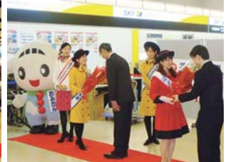
▲ 福岡便をお出迎え