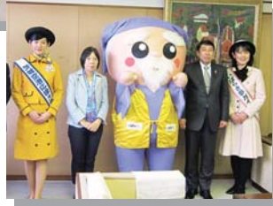
▲ 福岡県庁への訪問