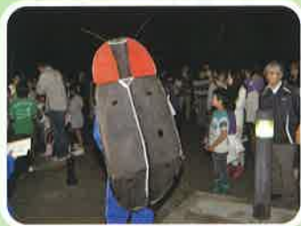
40年にわたる ホタルの研究と飼育