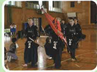
充実した部活動 6年生からの早期体験

幼 稚園の先生が隣の教室にいるから、毎日会えて嬉しいです。私は幼稚園生と一緒に遊ぶ「なかよしタイム」や、一緒に給食を食べるのがとても楽しみです。一年生になったので、優しくあげたいです。