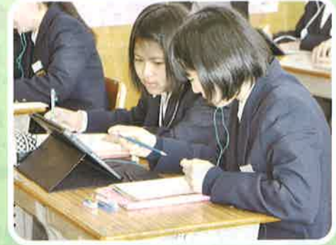
互いの考えを深め合える タブレットを活用した授業