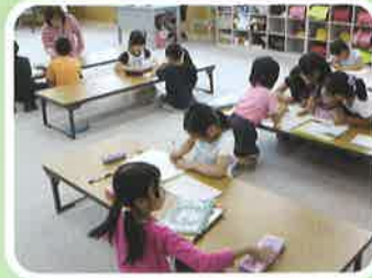
小規模校のため6年生まで 開放学級の利用が可能 (~18:30)