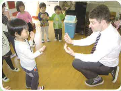
幼小中一貫した英会話 オール・イン・イングリッシュ