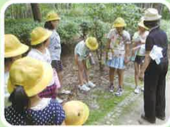
七ツ洞公園 活性化プロジェクト