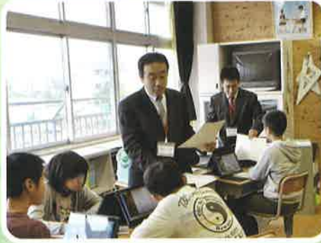
専門の先生による教科担任制や 複数の先生による学習指導