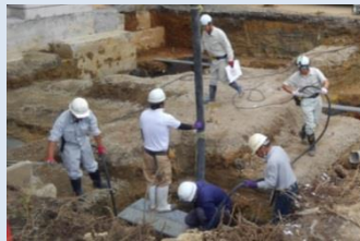
増築予定場所のコンクリート打設