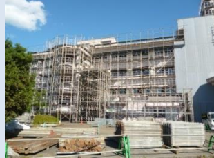
特別教室棟 昇降口側