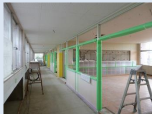
天井・間仕切り設置