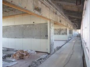
天井・内装解体 普通教室