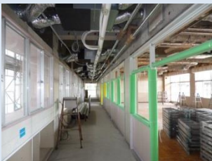
エアコンダクト配管

エアコンダクトの配管が進み、徐々に天井が仕上がってきました。それとともに教室と廊下の間仕切りも新しいものが設置されてきています。また、増築予定場所の基礎が完成しました。