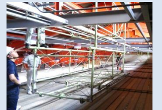
体育館吊り天井調査