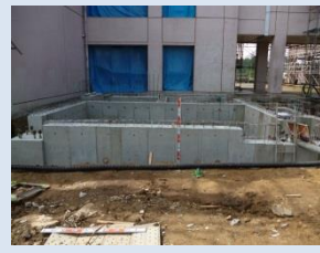
増築予定場所の基礎完成