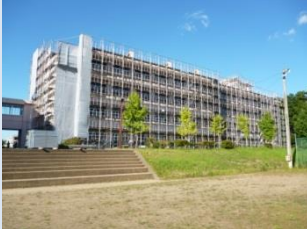
管理教室棟 グラウンド側

工事に本格着手するための調査や現場事務所の設置が行われ、校舎周り全面には足場が組みられました。校舎内部は、エアコン導入のために天井や内装の解体が始まりました。