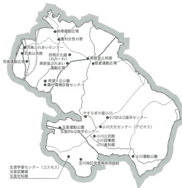
■生涯学習施設位置図

また、公民館などの生涯学習施設については、市民が様々な活動を推進するための十分な機能を備えているとはいえ、施設の整備充実や市民が利用しやすい施設運営を図る必要があります。さらに、図書館の運営については、市民ニーズを把握しながら、施設を充実させ、利便性向上を図るとともに多くの市民が本に接する機会を創出する必要があります。